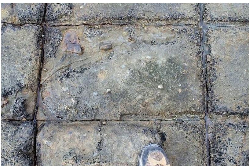
Cesta u Eaglehawk Neck