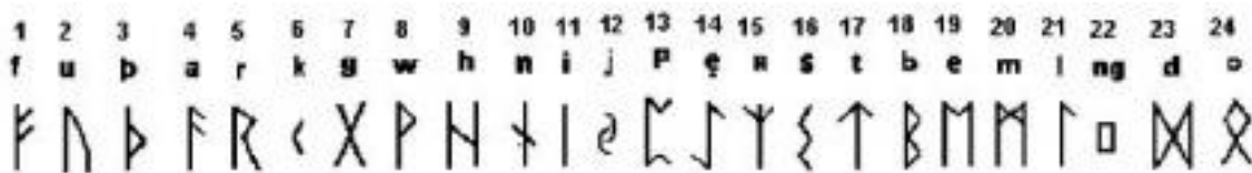
Футарк - германо-скандинавские руны

Ódin z nich pocítil sílu a celému okolí oznámil, že teď vládne světu on. Ale při prvních pokusech s runami, aby pod sebou přeorganizoval svět, ty ho začaly házet na zem, lámat kosti, vhadzovat na stromy vzhůru nohama a tak dále. Runy nechtěly vykonávat příkazy vytvářející zkázu a smrt. Tehdy Ódin a jeho družina začali vymýšlet způsoby, jak runy přelstít. Začali jim dávat jiné významy. Nakonec se zničené runy podřídily. Jejich zvuková struktura se však změnila. Písmo zůstalo stejné, ale zvukový význam se změnil. Tak vznikly skandinávské a germánské runy – futhark.