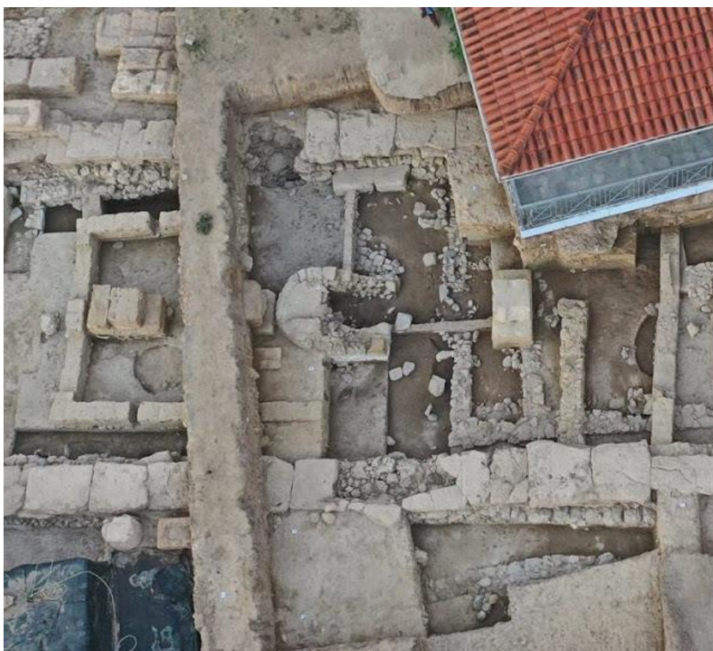
Fotografie chrámu Artemis na ostrově Euboea: