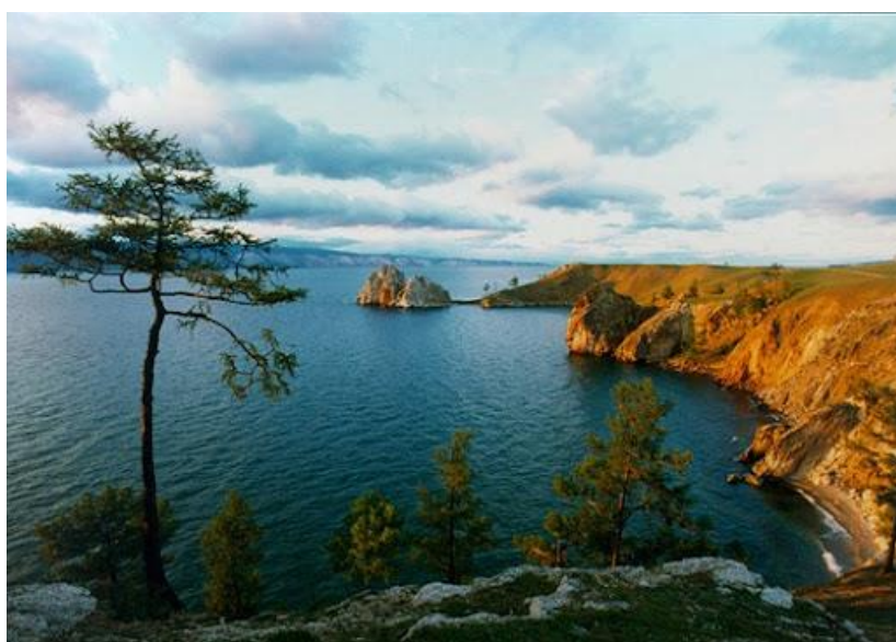
Zapsala Valeria Kolcova 28.03.23