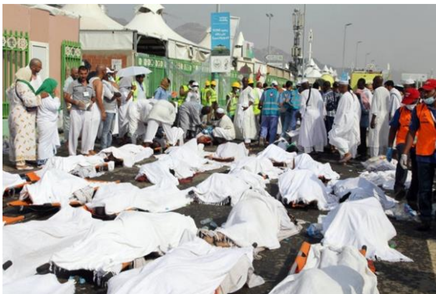
Události v Mekce 11. září 2015