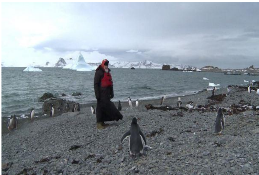
Patriarcha Kirill v Antarktidě