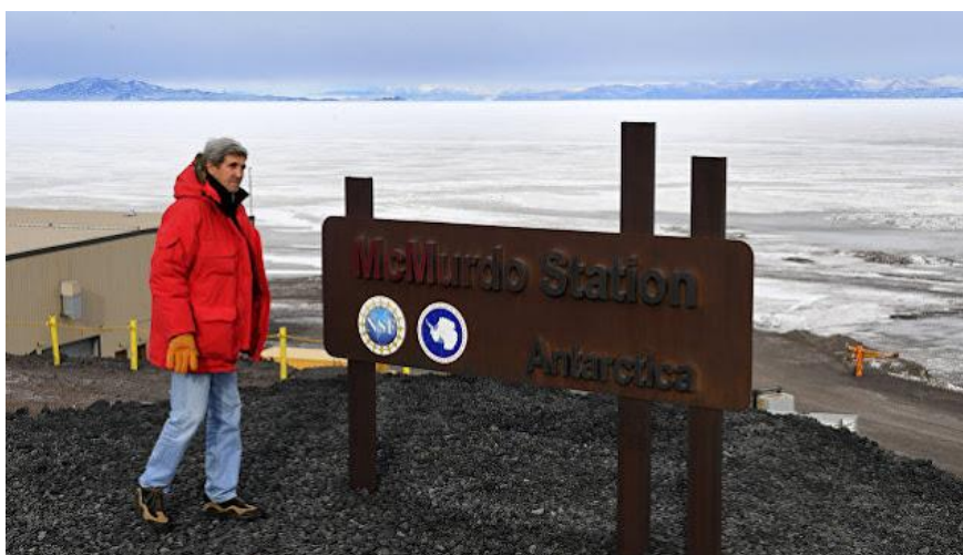
11. listopadu 2016, John Kerry v Antarktidě