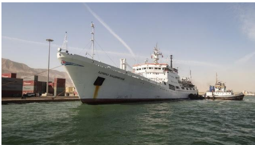
„Admiral Vladimirkij“ v přístavu Džidda v Saúdské Arábii