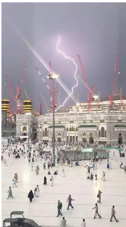
Události v Mekce 11. září 2015