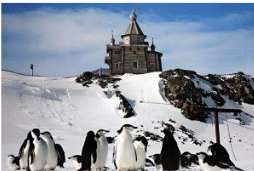
Kostel Nejsvětější Trojice v Antarktidě